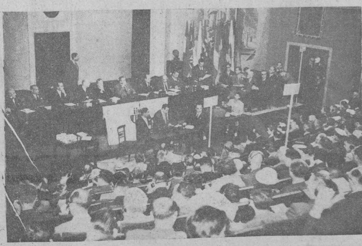
Madrid. — Un aspecto de la sesión inaugural de la IX Asamblea del Instituto Internacional de la Soldadura, en la Escuela de Ingenieros Industriales de la capital de España.