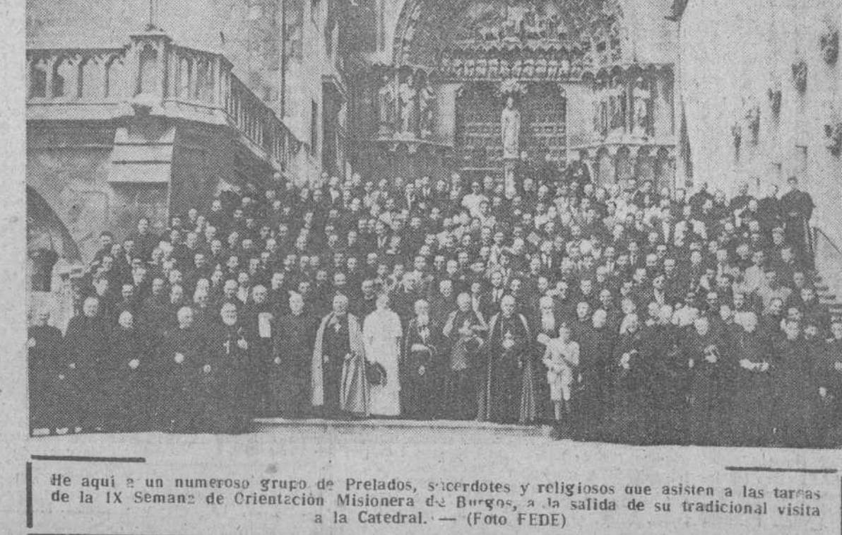
He aquí a un numeroso grupo de Prelados, sacerdotes y religiosos que asisten a las tareas de la IX Semana de Orientación Misionera de Burgos, a la salida de su tradicional visita a la Catedral.