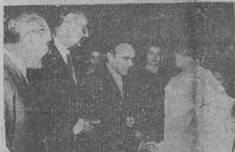
Valencia. — Los príncipes de Mónaco acompañados de las autoridades en el momento de saludar al delegado del Pabellón Marroquí, con motivo de su visita a la Feria de Muestras.