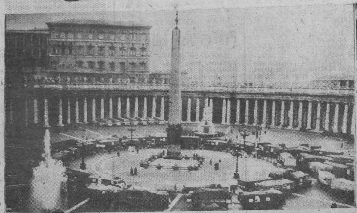
Formando un perfecto círculo en la Plaza de San Pedro, ochenta camiones con remolque esperan el momento de ser bendecidos por Su Santidad el Papa. Son portadores de regalos del Sumo Pontífice y serán distribuidos por toda Italia.

Los datos que preceden se refieren a la actividad de asistencia de obras pontificias solo en el año 1954, pero la caridad de Su Santidad ha tenido un campo mucho más dilatado en el tiempo y en el espacio, de forma que se la por decirlo así toda su vida. Es evidente que el grado de excelencia de esta virtud no puede estimarse estadísticamente, por los resultados obtenidos o por los recursos puestos en juego. Hay que atender a otros aspectos y matices que solo las almas sensibles pueden percibir. Vamos a referir el testimonio de un oficial, medalla de oro en la guerra de liberación española que recibió la asistencia de Pío XII. Dice así: "Estamos de rodillas... Me habla, quiero saber de mí... Tiene noticias de la medalla de oro que he ganado en la guerra de España... Su interés es seguida por mi familia y ocide a la mamaita que llora... Pregunté a mi hija por sus estudios y me habla otra vez, asegurándose que me entiende perfectamente, a pesar de mi afección. No se le escapa una palabra. Hay en su rostro una bondad infinita y en su palabra una dulzura que llega al corazón. En su trato, una afabilidad que conquista el alma y que le hace aparecer grande, verdaderamente grande... Diez minutos que quedarán para siempre en mi recuerdo y en mi corazón".