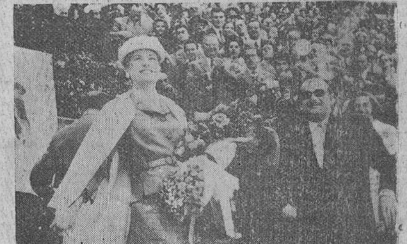
Palma de Mallorca. — Con ocasión de su estancia en esta ciudad, se organizó una corrida de toros en honor de los Príncipes de Mónaco, los cuales, como puede verse en la fotografía, atrajeron las miradas de los espectadores.

CORRIDA DE TOROS EN HONOR DE LOS PRINCEPES DE MONACO