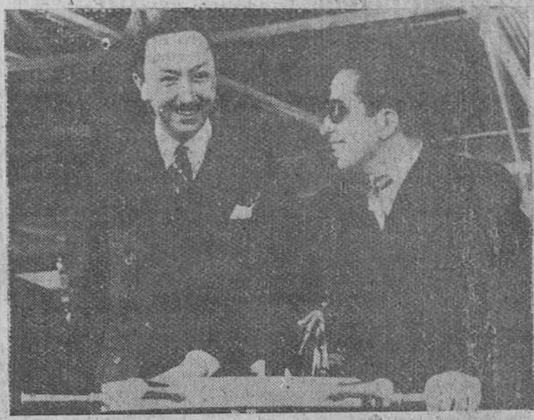
El Rey Faisal II del Iraq y su tío el Príncipe Abdallah que ayer llegaron a Madrid, en una reciente fotografía.