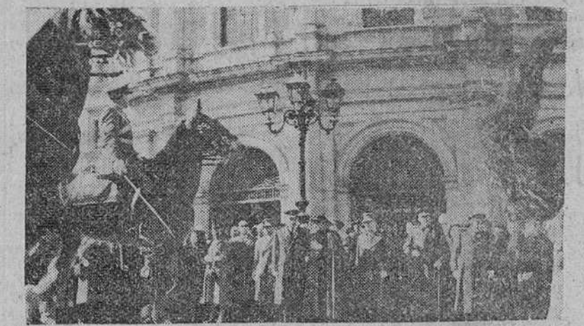
Madrid.—El ministro de la Gobernación con el director general de Seguridad y otras personalidades, presidió la solemne función religiosa celebrada con motivo de la festividad del Santo Ángel de la Guarda, en el Templo de San Francisco el Grande.