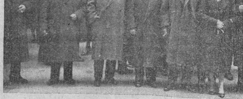
Profesionales burgaleses del Gremio de los Sastres, que ayer conmemoró la fiesta de su Patrona, Santa Lucía, fotografiados a la salida de la iglesia de San Lorenzo, donde asistieron a una solemne misa.