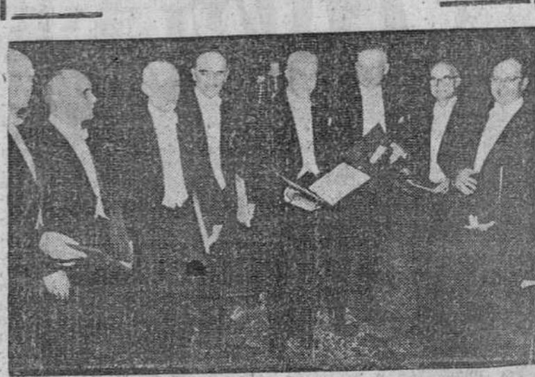
Estocolmo. — De izquierda a derecha: Dickinson W. Richard, Andre F. Courmand, Sir Cyril Norman Hinshelwood, Nikolaj N. Semenov, Walter Houser Brattain, Werner Forssmann, William Shockley y John A. Bardeen, galardonados con los Premios Nobel juntamente con el poeta español Juan Ramón Jiménez, (que no pudo asistir al acto), después de recibir su premio.