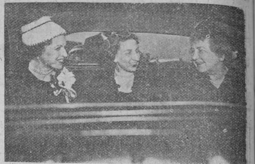
Washington. — La esposa del ministro de Asuntos Exteriores, señora de Martin Artajo, la Condesa de Motrico y la esposa de Mr. Dulles, momentos después de la llegada al aeropuerto de esta capital del señor Martin Artajo y las personalidades que le acompañan en su viaje a Norteamérica.