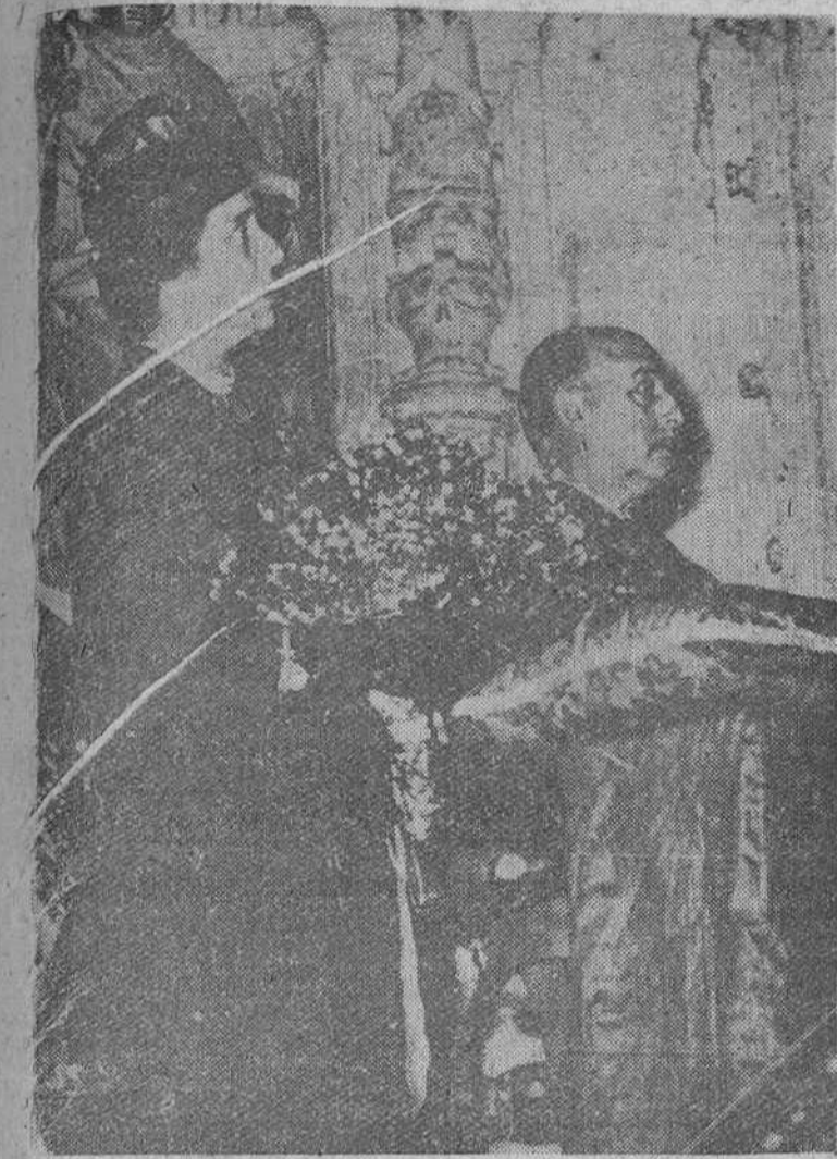
Sevilla. — El Jefe del Estado, Generalísimo Franco y su esposa, doña Carmen Polo, postrados ante el altar de la Virgen de los Reyes, en la capilla de la Catedral, durante la Salve que se entonó.

Sevilla. — S. E. el Jefe del Estado ha permanecido en su residencia del Alcázar durante toda la tarde.