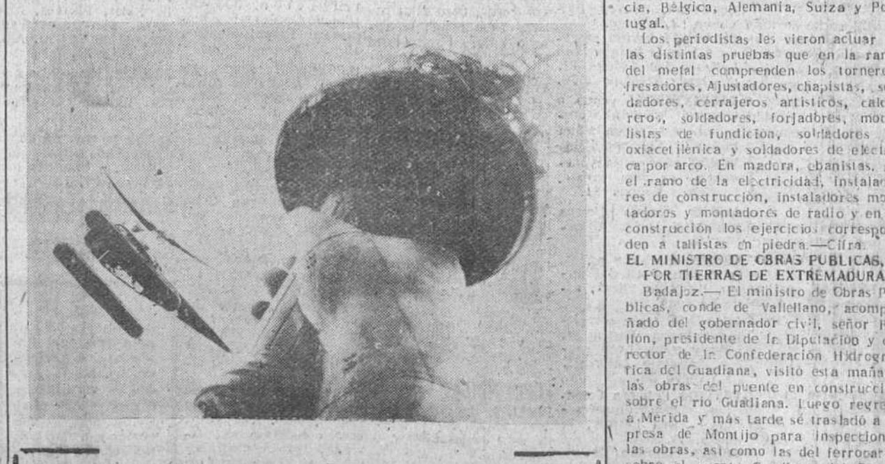
Nueva York. — El helicóptero de bordo del cual viajaba el señor Martín Artajo, volando alrededor de la antorcha de la estatua de la Libertad, momentos antes de aterrizar en Manhattan, donde el ministro español recibió la bienvenida oficial de esta ciudad.