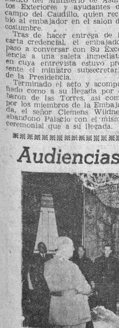
Madrid.—S. E. el jefe del Estado durante la audiencia concedida a la comisión del Ayuntamiento de Bermeo, presidida por el gobernador civil de Vizcaya.