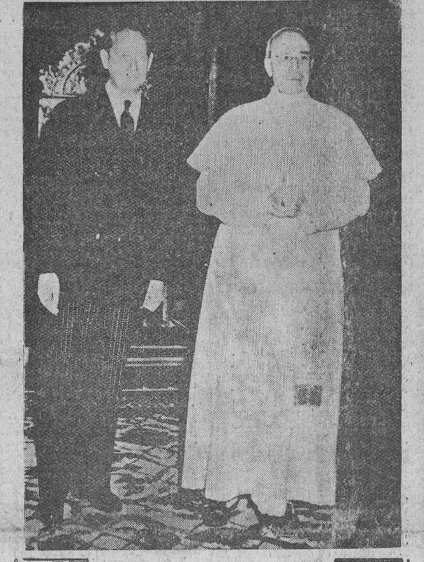
Ciudad del Vaticano.—S. S. Pio XII con el secretario general de las Naciones Unidas, Mr. Dag Hammarsjoeld, al que recibió en audiencia especial.