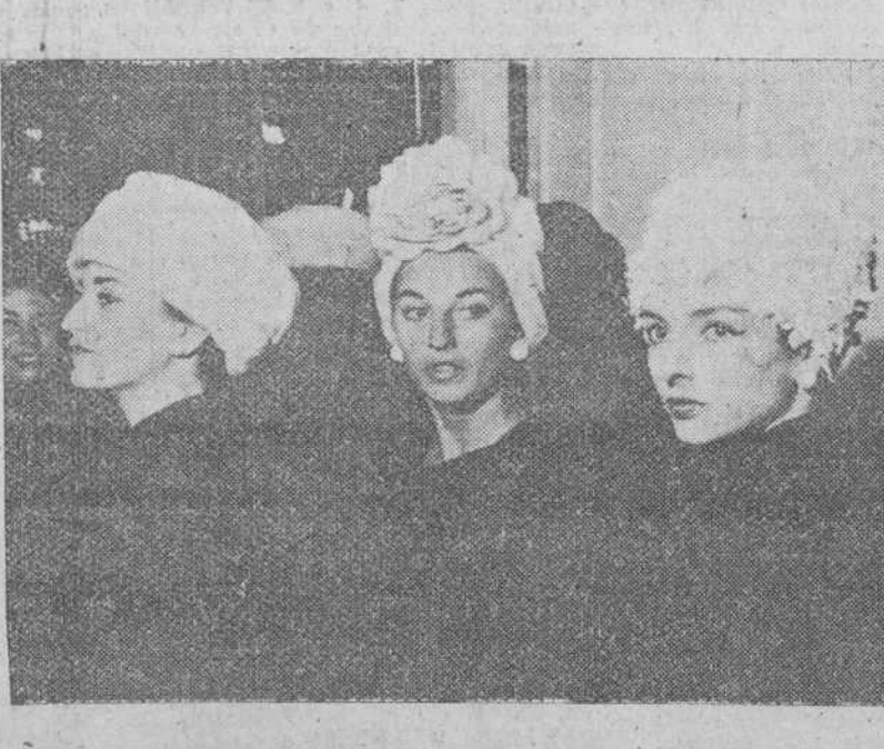
Barcelona. — Originales sombreros que se han exhibido en el Salón de la Moda Española presentado por la Cooperativa de Alta Costura.