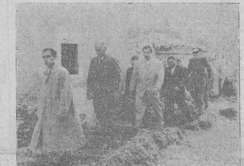
Cervera del Rio Alhama. — El ministro secretario general del Movimiento, Sr. Arrese, acompañado del gobernador civil de Logroño y otras autoridades, recorre los lugares afectados por las inundaciones habidas con motivo de las últimas tormentas.