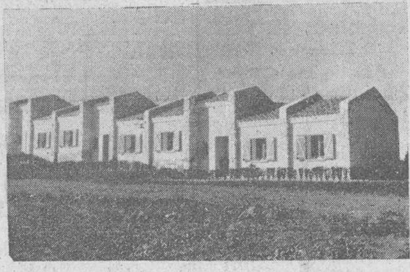
De aquí el magnífico grupo de viviendas para obreros de la Granja aneja a la Escuela de Agricultura que fue inaugurado ayer.

Si grandes fueron las satisfacciones experimentadas por los miembros del Consejo de Gobierno de la Caja de Ahorros Municipal, en las dos primeras jornadas de conmemoración del XXXV "Día Universal del Ahorro", al visitar las Escuelas Profesionales Femeninas de la barriada "Yague", comprobando su consolidado funcionamiento y rendimiento y la zona urbanística de "Los Niveles", donde la benéfica acción social de la Caja ha proporcionado cobijo confortable y económico a cerca de quinientas familias, burgalesas, ayer subió de punto esa alegría íntima con la inspección girada a la Escuela de Agricultura de Saldañuela, verdadero seminario, auténtica universidad de la juventud campesina de nuestra provincia.