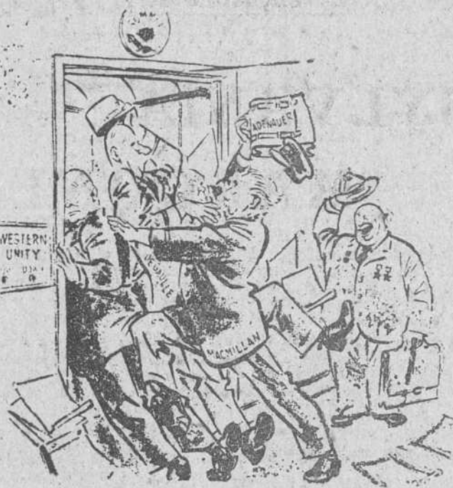
Se trata, según el caricaturista del norteamericano "The Sacramento Bee", del "asesor de la unidad accidental", a punto de iniciar su subida hacia "la cumbre" de las conferencias. Adenauer, maltruchado, ha sido lanzado contra "la violencia que está a punto de perder el tepis. Ike va detrás. El que empuja a todos es Mac Millan. Y Kruschef, sonriente, le deja hacer y pregunta: "¿Parece que vamos a subir, zeh?". La verdad es que los cosas no son tan sencillas. Y que, quizá, el ascensor tarde todavía un poco en emprender su camino.

FIDEL CASTRO Y EL "ANTI-FIDELISMO" Nuevos episodios de la resistencia creciente en Cuba contra la política de Fidel Castro acaban de producirse. Dos aviones procedentes de Florida han lanzado sobre La Habana miles de prospectos antifidelistas, firmados por Pedro Luis Díaz Lanz, jefe supremo de las fuerzas aéreas cubanas y amigo de Castro hasta Junto último en que huyó a los Estados Unidos, donde le acusó de "abiertamente comunista". El comandante de la provincia de Camagüey, Huberto Matos, ha dimitido su cargo como protesta contra la infiltración comunista en los órganos gubernamentales. Unos coches han recorrido la capital, según parece, tirando bombas: Hubo dos muertos y 46 heridos. Matos se ha dejado defender sin resistencia. Reacción de Castro: ante todo, detener, personalmente, a Matos, para lo que se trasladó a Camagüey, mientras la radio decía a los campesinos: "¡Dejad los campos, montad a caballo, id a Camagüey para apoyar la revolución!". Después, el día 22, pro-