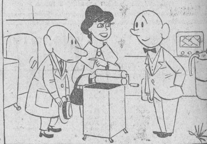
—Si, si; explíqueme bien a mi marido cómo se maneja.