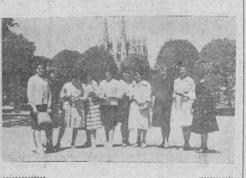
Ayer dieron comienzo en nuestra ciudad los ejercicios de oposición a ingreso en el Magisterio nacional. A la salida de la primera sesión, un grupo de gentiles opositoras posó para nuestro periódico.