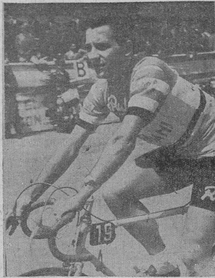
El gran corredor francés Roger Riviere, recordman de la hora y una de las grandes figuras del ciclismo europeo, que ayer venció en la etapa-reina, Eibar-Vitoria.