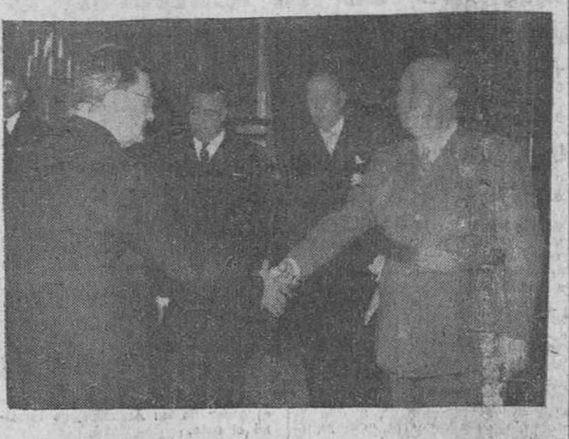
El Pardo. — Su Excelencia el Jefe del Estado con la comisión de la Agrupación Nacional de Constructores de Obras Públicas, presidida por don Ramón del Caso.