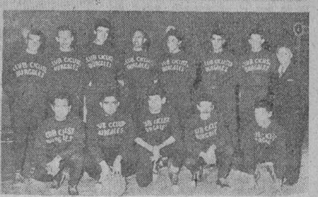
Equipos de Vitoria, Zamora, Ciudad Real y Burgos, que anoche participaron en los partidos de baloncesto correspondientes a los campeonatos de Segunda División.