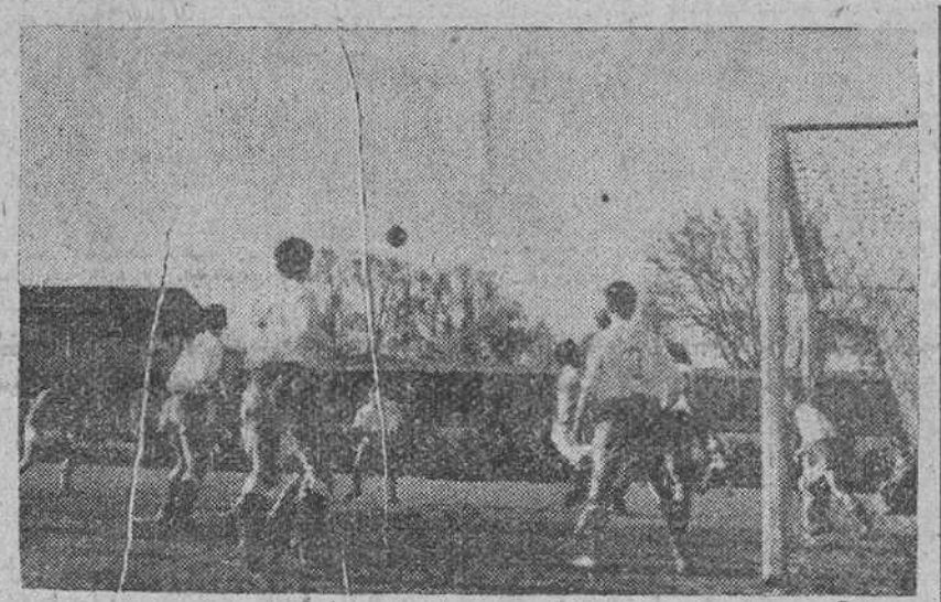
He aquí una de las jugadas de acoso producidas frente al marco del Plasencia, aunque finalizada sin resultado práctico alguno.

Carente de sus cualidades fundamentales, los locales permitieron a los forasteros imponer su dominio técnico