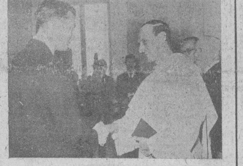
Homenaje nacional al Padre Pire

En el palacio de las Academias, de Bruselas, ha tenido lugar una sesión de homenaje nacional al Padre Pire, Premio Nobel de la Paz. En la foto aparece el Príncipe Alberto, representando a la Familia Real belga, saludando al Padre Pire.