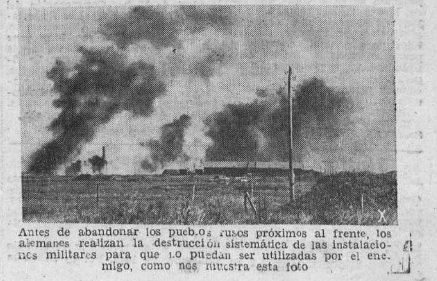
Antes de abandonar los pueblos rusos próximos al frente, los alemanes realizan la destrucción sistemática de las instalaciones militares para que no puedan ser utilizadas por el enemigo, como nos muestra esta foto