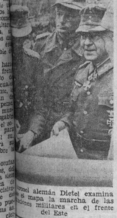
El general alemán Dietel examina el mapa de la marcha de las tropas militares en el frente del Este