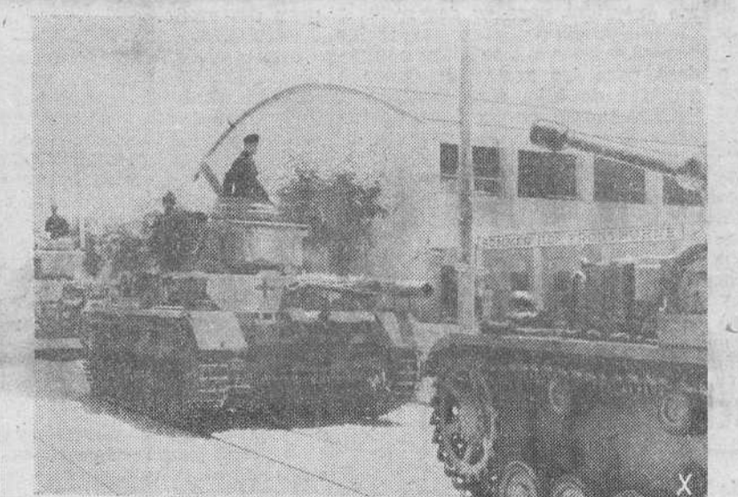
Una columna de tanques alemanes atraviesa Salónica con dirección a las costas del mar Egeo para guarnecer éstas contra posible desembarcos