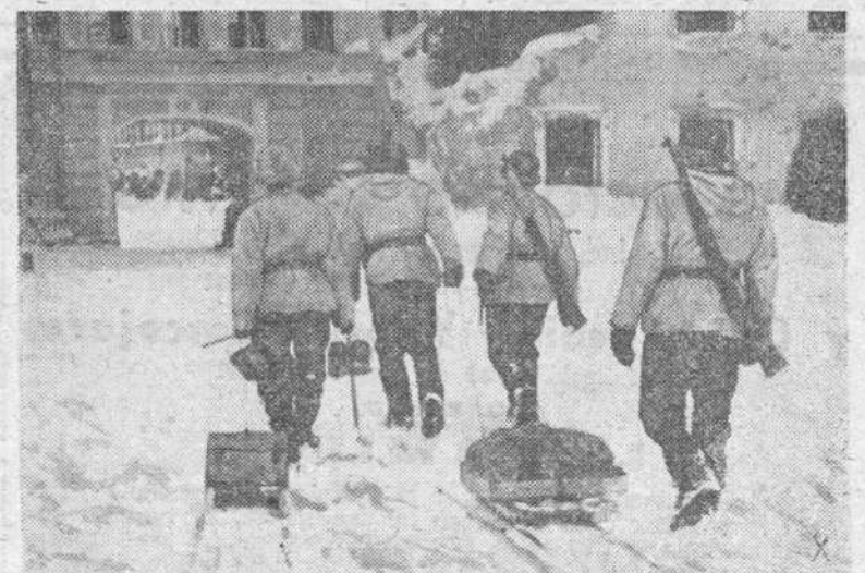
El crudísimo temporal bajo el que se desarrolla la lucha en el frente ruso, queda reflejado en estos documentos gráficos. En la parte superior vemos un refugio con la entrada completamente cubierta por la nieve y en la inferior, los soldados alemanes transportando viveres y municiones mediante la utilización de pequeños trineos