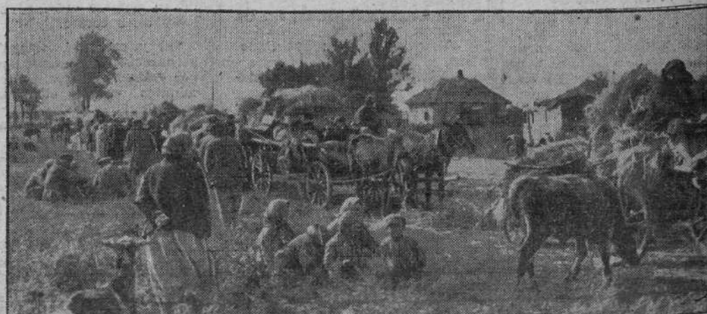
Una caravana de campesinos rusos que no quieren volver a ser víctimas de los soviets y abandonan sus hogares con las tropas alemanas