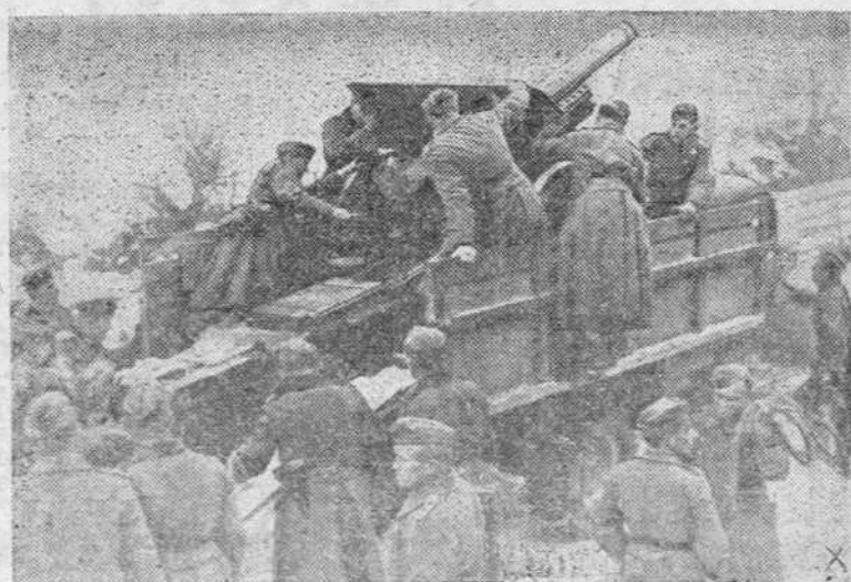
Cañones alemanes son cargados sobre autocamiones