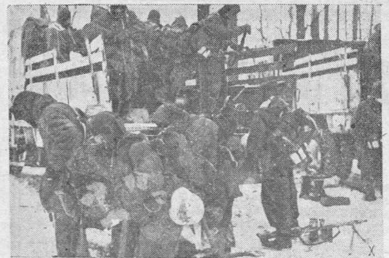
Un contingente de fuerzas alemanas al lugar donde la lucha contra el. Los soldados van bien pertrechados