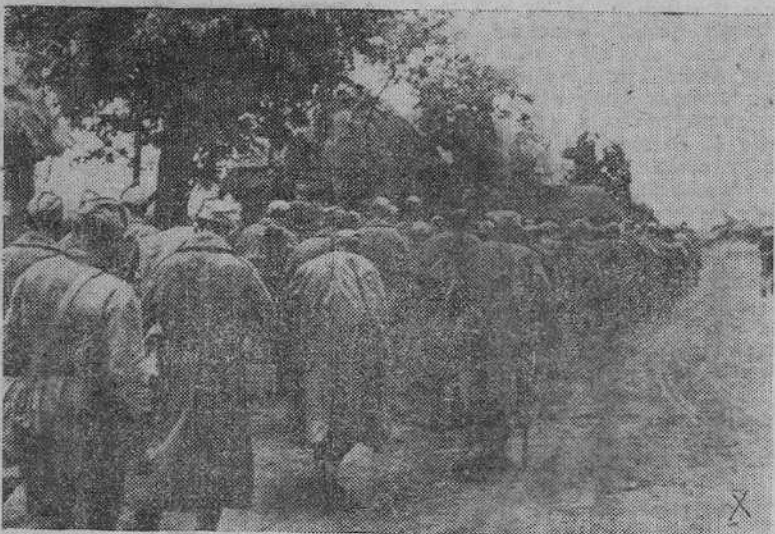
Largas columnas de prisioneros soviéticos son conducidos a las líneas de retaguardia alemana para su internamento en campos de concentración