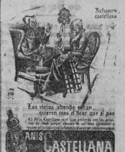
Los victos adonde están, quieren mas el licor que el pan. El vino castellano es el licor preferido por los soldados de cada parte de la guerra. El vino castellano es el licor preferido por los soldados de cada parte de la guerra.

El barrio más afectado ha sido el de Courbevois; a las 23 horas habian sido recogidos 60 muertos. En Beaulieu Bruyeres, el número de heridos es de unos 200 y el de muertos no se conoce aún. También en Agareune ha habido numerosos muertos y heridos. En el mismo París, el barrio más afectado ha sido otra vez el de Auteuil. Han quedado destruidas muchas casas y las calles están sembradas de escombros abiertos por las bombas. Numerosas casas están ardiendo todavía. Los equipos de salvamento de la Cruz Roja, de la defensa pasiva y de la