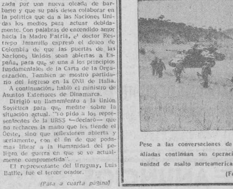
Pese a las conversaciones de paz en Pan Mun Jón, las tropas aliadas continúan sus operaciones en Corea. Aquí vemos a una unidad de asalto norteamericana dirigiéndose a la línea de fuego.