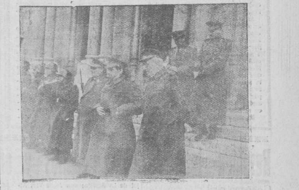
Alrededor de las nueve y media de la mañana de ayer, en avión y procedente de Madrid, llegó a nuestra ciudad, el ministro del Ejército, teniente general Muñoz Grandes, acompañado por sus ayudantes.

Visitó Capitanía General y la Academia Preparatoria Militar de la Sexta Región y regresó por la tarde a Madrid