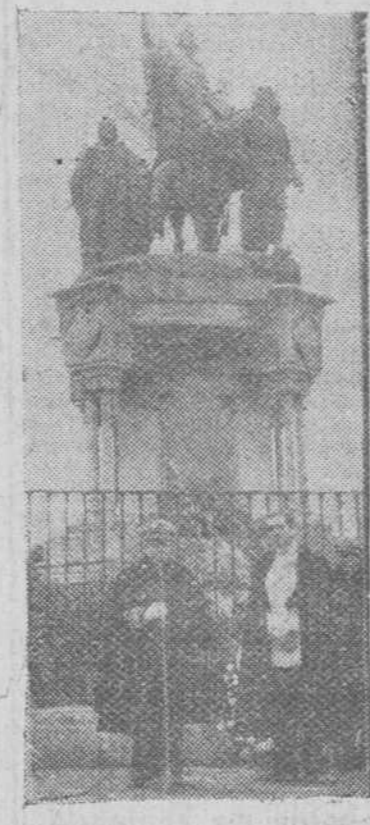
Madrid. — La Marina de guerra brasileña ha rendido un homenaje a la Reina Isabel la Católica. Representaron al país hermano el comandante y la oficialidad del buque-escuela de aquel país "Almirante Salchana", surto en la actualidad en aguas españolas.

Homenaje de la Marina brasileña a la Reina Isabel