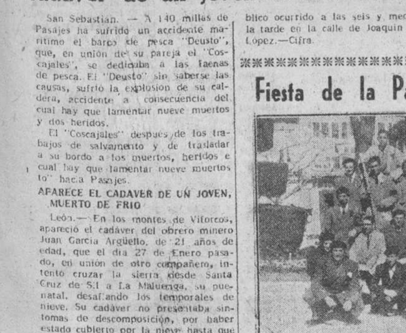
Los jardineros municipales solemnizaron ayer la fiesta de su Patrona, Santa Casilda. Aquí les vemos, posando para "Fede", en el anden de Marceliano Santa María, en el paseo del Espolón