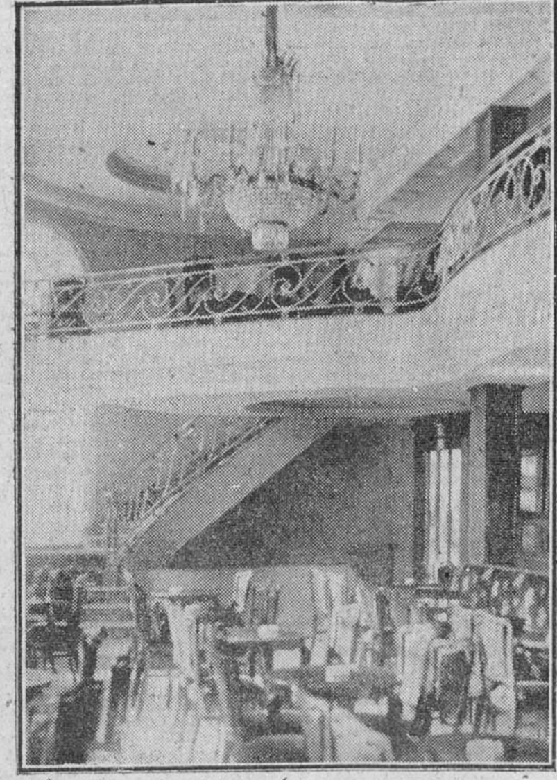
Perspectiva de uno de los rincones del elegante Restaurante "Pinedo", inaugurado el pasado jueves.

Dotado de elegante instalación, selecta cocina y escogido servicio, el nuevo Restaurante es un orgullo para Burgos