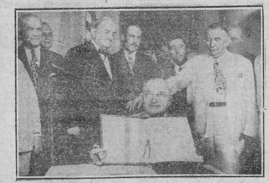
Washington. — El presidente Truman muestra el original del Pacto del Atlántico Norte, después de haber sido ratificado por el Congreso. Le acompaña, a la izquierda, el secretario de Defensa Johnson, el senador Lukas, Tom Connally; y el secretario de Estado Acheson y otros senadores.