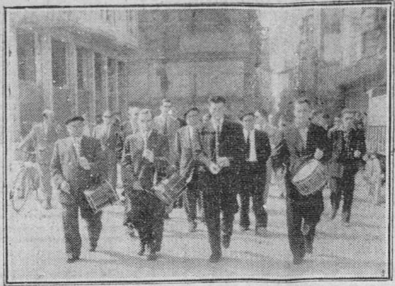
La "Casa Vasca", recientemente constituida en nuestra ciudad, celebró el domingo, por vez primera, la festividad de su Patrón, San Ignacio de Loyola. En nuestra foto, un grupo de vascos residentes en nuestra capital, se dirigen, después de celebrada solemne misa y precedidos de los típicos chistularis, al restaurante donde tuvo lugar la comida íntima conmemorativa.