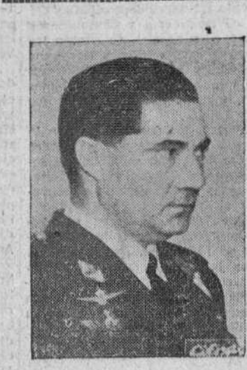
GENERAL GONZÁLEZ GALLARZA

POR SU DECISIVA AYUDA A LA CONSTRUCCION DEL MAGNIFICO AEROPUERTO DE SONDICA