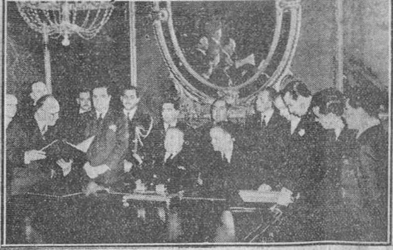
Lima.—El ministro de Relaciones Exteriores, capitán de navío, don Ernesto Rodríguez y el embajador español, señor Castiella, durante la firma de dicho protocolo coincidiendo con el aniversario de la normalización de las relaciones diplomáticas hispano-peruanas.

Hongkong.—La guarnición gubernamental de Changsha, capital de la provincia de Hunan, se ha rendido anoche a los comunistas, según anuncia el diario pro-comunista de esta ciudad "Wen-