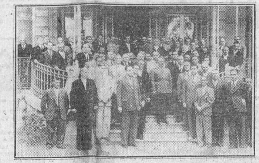
San Sebastián. — S. E. el jefe del Estado con los alcaldes de todos los Ayuntamientos de Guipúzcoa, que acudieron al Palacio de Ayte para cumplimentarle y expresarle su inquebrantable adhesión.