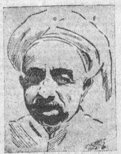
EL REY ABDULLAH

Su Majestad el Rey Abdullah I será recibido oficialmente por el jefe del Estado español, Generalísimo Franco. Al terminar la estancia regia en Galicia, el Rey del Jordán marchará, asimismo, en viaje oficial a la capital de España acompañado del ministro de Asuntos Exteriores. Desde Madrid, en viaje privado, Su Majestad efectuará una excursión turística a Granada y Sevilla.