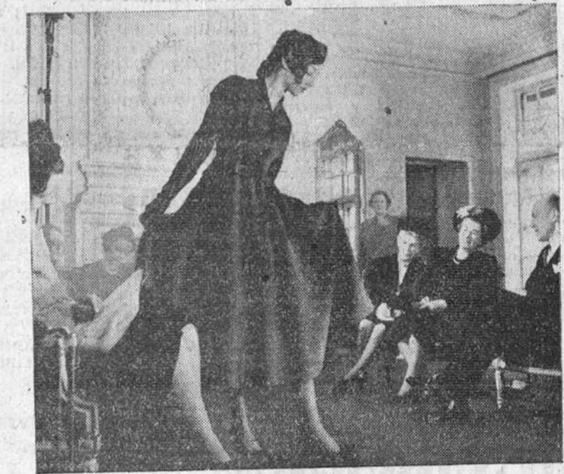
Desfile de los últimos modelos creados por una prestigiosa Casa de modas de Londres para la próxima temporada otoño. A juzgar por la foto la falda larga —aunque algo más corta— continuará "privando" entre el bello sexo.

"El cincuenta por ciento de las tropas rusas de ocupación desertaría si pudiese", afirma un ex-oficial soviético