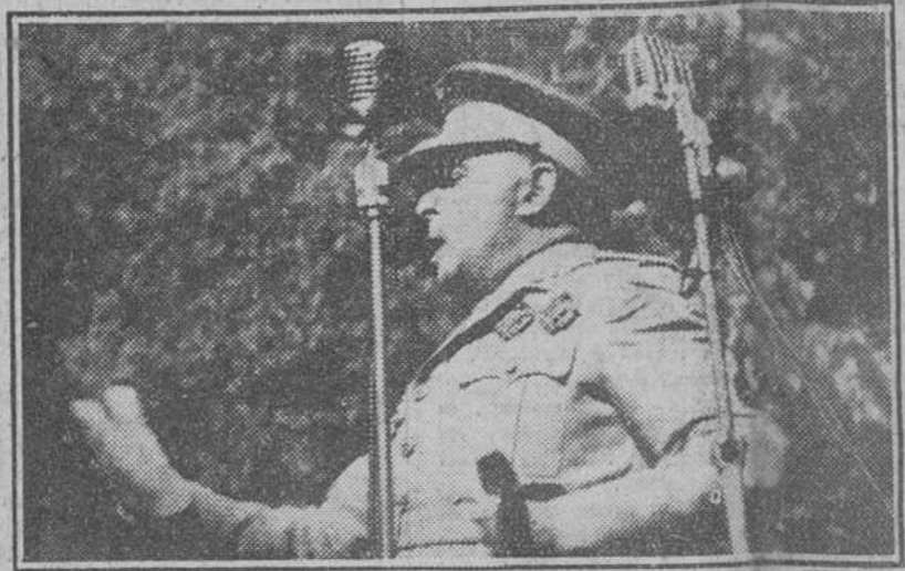
Melilla.—El Teniente General Varela se dirige a los cabilenos del poblado de Beni-Aros.—(Foto CIFRA)