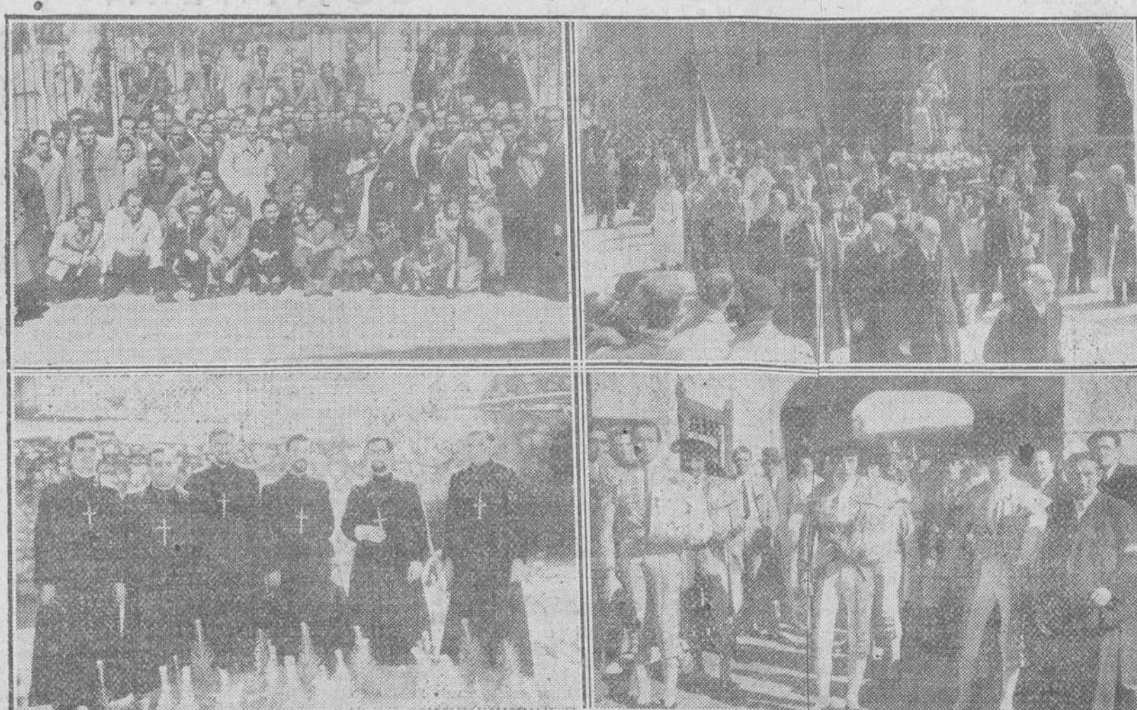
REPORTAJE DE «FEDE» SOBRE LOS ACTOS CELEBRADOS EL DOMINGO ULTIMO. — Arriba y de izquierda a derecha, grupo de tipógrafos a la salida de la fiesta religiosa celebrada con motivo de la fiesta de San Juan Ante Portam Latinam y un detalle de la procesión celebrada por los Obreros Católicos, en la festividad del Patrocinio de San José. — Abajo, grupo de los seis misioneros que recibieron el Santo Crucifijo a mediodía, de manos del Excelentísimo Sr. Arzobispo. Y, finalmente, momento de la salida de las cuadrillas en el festejo inaugural de la temporada taurina.