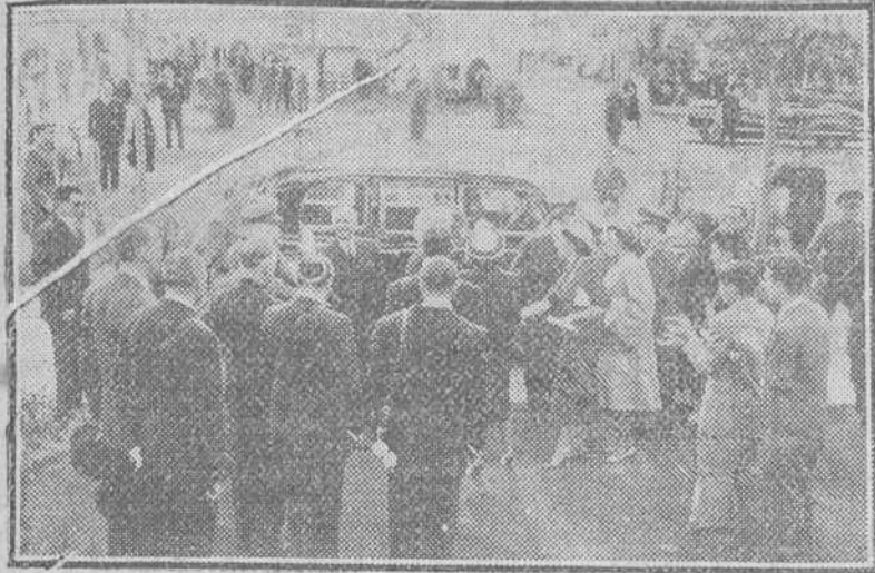
Madrid.—S. E. el jefe del Estado, acompañado de su esposa, presenció el domingo último la prueba hípica denominada «Copa del Generalísimo», en la novena jornada de carreras de caballos de la temporada de primavera en el Hipódromo de la Zarzuela. Terminada la prueba, que fue ganada por el caballo «Pandora», montado por Jiménez, adjudicándose 25.000 pesetas y el aludido trofeo, S. E. y su esposa fueron objeto de una cordial ovación del público que asistía a la reunión hípica, reiterándose el cariñoso homenaje recibido por el Caudillo al hacer su entrada en el Hipódromo.

El Caudillo presenció en unión de su esposa, la prueba hípica denominada «Gran Premio del Generalísimo»