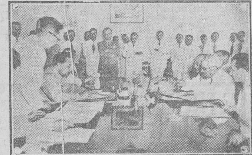
Manila.—Los señores Quirino, Presidente de la República y Aguilar, ministro de España, firmando los tratados.