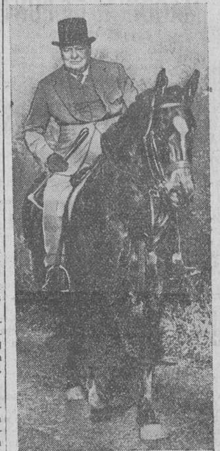
Al ex-premier británico aún le sobran energías para practicar la equitación a pesar de sus 74 años, recientemente cumplidos. Aquí aparece, sobre brioso corcel, en una cacería celebrada en el condado de Yorkshire

Tel-Aviv.—El Estado de Israel ha protestado oficialmente ante el mediador de la O.N.U., de que las tropas de Transjordania están ocupando las posiciones de las fuerzas del Irak, en el frente central de Palestina. El portavoz militar judío ha manifestado que los delegados israelitas en Rodas han informado a Bunche que consideraban tal caso como una grave violación de la tregua.—Efe.