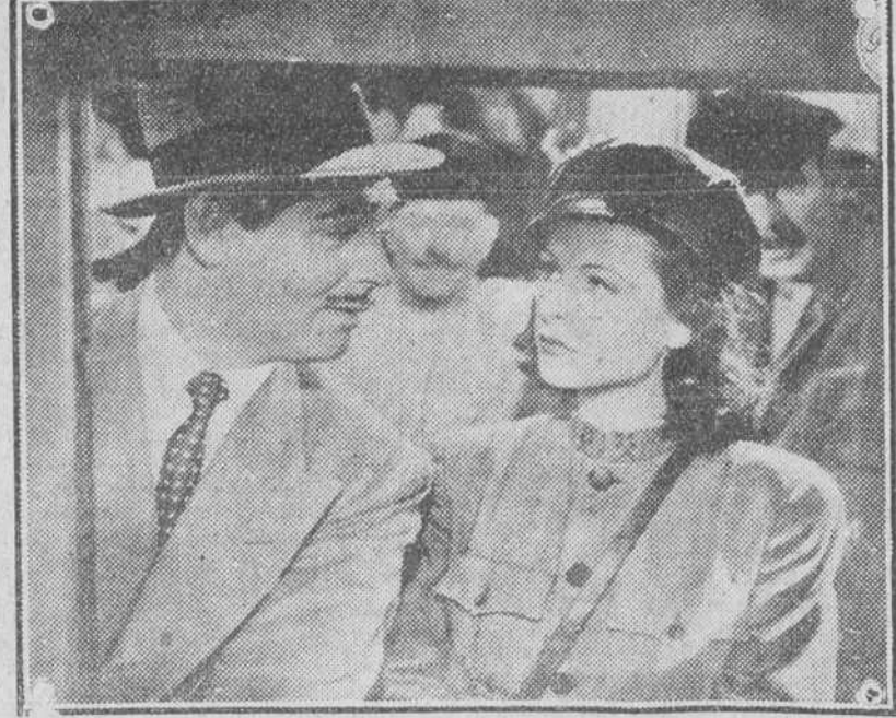
La bellísima Hedy Lamarr y el siempre joven y apuesto Clark Gable, son los intérpretes de "Comarada X", la excepcional y humorística cinecomedia americana que se estrena esta tarde, en "Galas de Prensa" en el Cordon y cuya exhibición en nuestras pantallas ha de constituir señaladísimo acontecimiento.