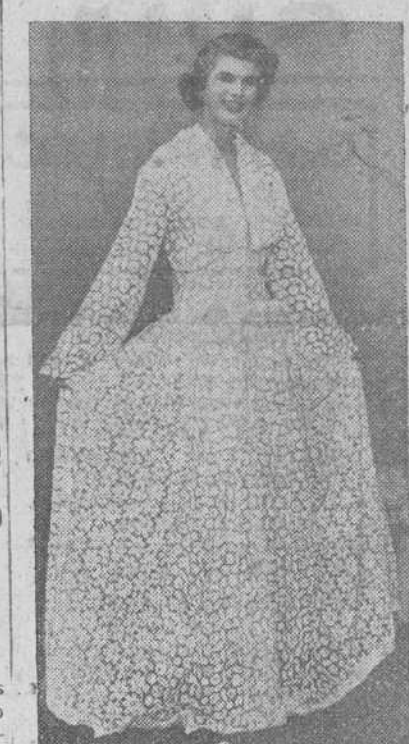
En una de las recientes exposiciones celebradas en París, llamó poderosamente la atención este precioso modelo exhibido por un famoso modisto parisien. Es un vestido de noche, confeccionado todo él en encaje de Malinas, con amplia falda y bolero de la misma tela