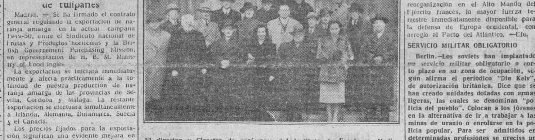
El director y Claustro de profesores del Instituto de Enseñanza Media, fotografiados a la salida de la iglesia de San Nicolás, después de asistir a la misa celebrada ayer.

Madrid. — Se ha firmado el contrato general regulando la exportación de naranja amarga en la actual campaña 1949-50, entre el Sindicato nacional de Frutas y Productos hortícolas y la British Government Purchasing Mission, en representación de H. B. M. Ministry of Food, Inglaterra. —