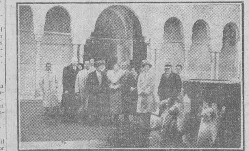
GRANADA.—DIHOS REPRESENTANTES DURANTE SU VISITA A LA ALHAMBRA.—(Foto Cifra)