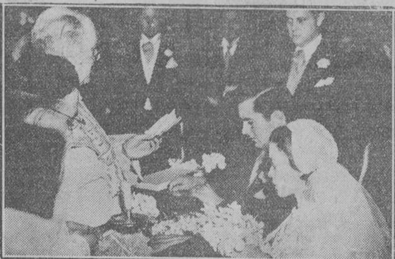
ROMA.— UN MOMENTO DE LA CEREMONIA DE ENLACE MATRIMONIAL DEL FAMOSO ACTOR CINEMATOGRAFICO AMERICANO TYRONE POWER CON LINDRA CHRISTMAN, CELEBRADA EN EL TEMPLO DE SANTA FRANCISCA, DE ESTA CAPITAL.