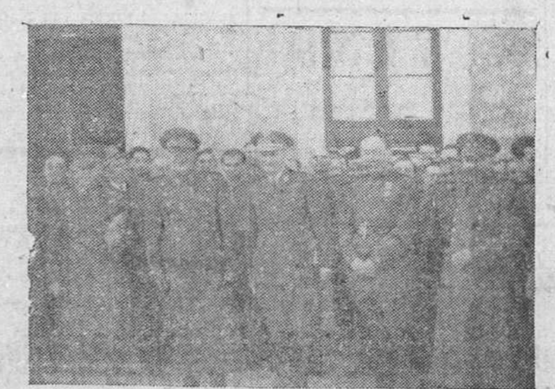
Con motivo de las festividades de Todos los Santos y Animas, el cementerio de San José se ha visto estos días muy concurrido, siendo numerosos los fieles que acudieron a rezar y depositar flores en las tumbas.