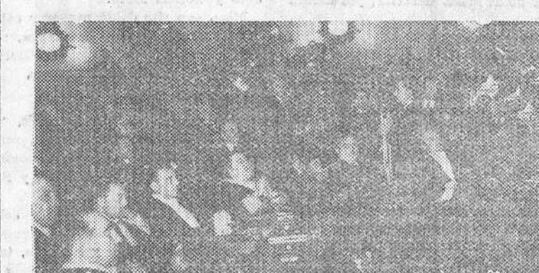
Buenos Aires.— Con asistencia de los miembros del nuevo Gobierno, del Cuerpo Diplomático y de las Embajadas especiales, el Presidente Perón inaugura con toda solemnidad, el nuevo Periodo Legislativo argentino. Nuestra fotografía recoge el banco donde se sientan los nuevos miembros del Gobierno durante dicha lectura