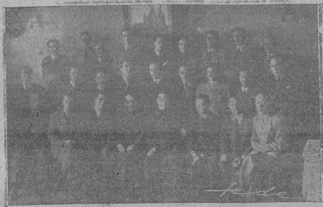
Los periodistas iniciaron el domingo último los actos conmemorativos de la festividad de San Francisco de Sales, su Patrón. He aquí la placa lograda por FEDE al concluir la comida de hermandad celebrada en Burgos

Existe la posibilidad de enviar un cohete a la Luna y que vuelva al punto de partida