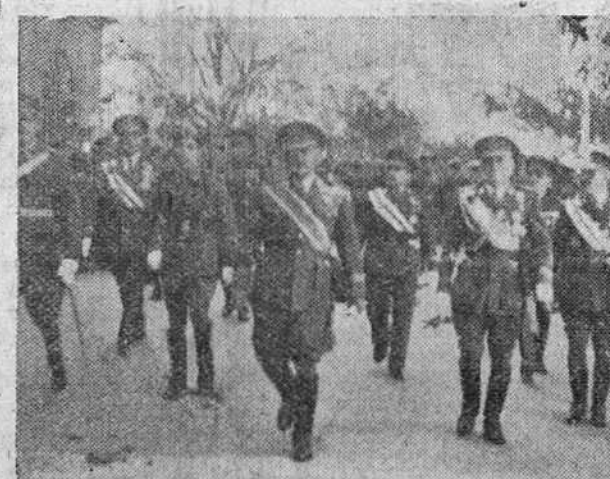
De izquierda a derecha: El Gobierno espera la llegada de S. E. el Jefe del Estado, en la escalinata de Capitanía.—El Caudillo, a su llegada a aquí, corresponde, emocionado, a las aclamaciones de la multitud.—Terminada la ceremonia conmemorativa de la exaltación del Caudillo a la Jefatura del Estado, el Ayuntamiento de Burgos abandona el histórico Palacio, llevando en sus filas a los alcaldes de Madrid y Valencia, que acompañan a nuestra primera autoridad municipal.—El Generalísimo Franco pasa revista a los caballeros cadetes de la Academia de Ingenieros, a su llegada al Palacio de la Diputación, para recibir el homenaje de la Mancomunidad de Diputaciones.