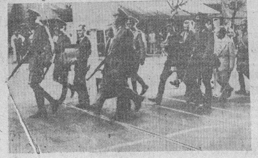
Custodiadas por las tropas del ejército argentino, son llevadas las urnas que contienen las papeletas de los votantes, para el recuento de votos, después de cerrarse la jornada electoral