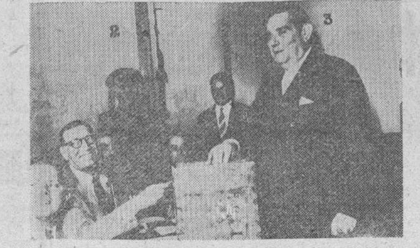
El doctor Tamborini, candidato a la Presidencia de la República Argentina por la Unión Democrática, emite su voto en el correspondiente distrito de Buenos Aires