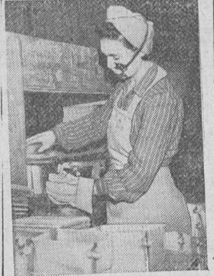
Finalizada la cantienda mundial una gran factoría inglesa de aviones ha sido habilitada para producir utensilios domésticos. He aquí a una obrera entregada a la fabricación de cacerolas.

Los estudios de aviación se realizan en la Escuela de Aviación de Córdoba y existen otras varias civiles. Las perspectivas de la aviación en la Norteamericana, se permite a los alemanes criticar la ejecución de las disposiciones aliadas de ocupación, pero no las disposiciones mismas.