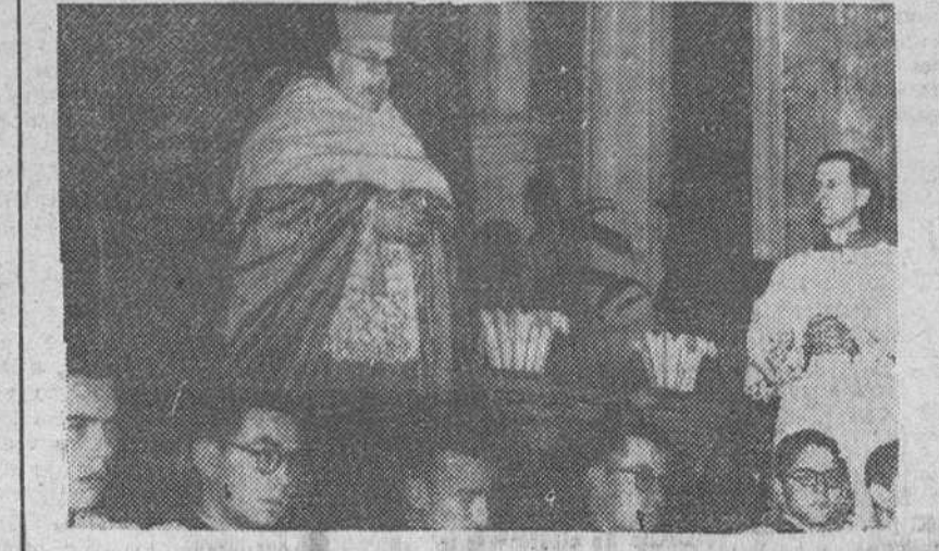
El Cardenal Primado de España, Arzobispo Dr. Prá y Daniel, toma posesión de la Iglesia de San Pedro y Montorio de Roma, simbólica diócesis de su cardenalato