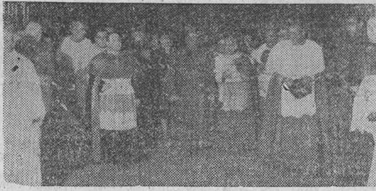
Zaragoza.—S. E. el jefe del Estado, con el Arzobispo, doctor Domenech y clero de la Catedral, a su llegada al templo del Pilar.