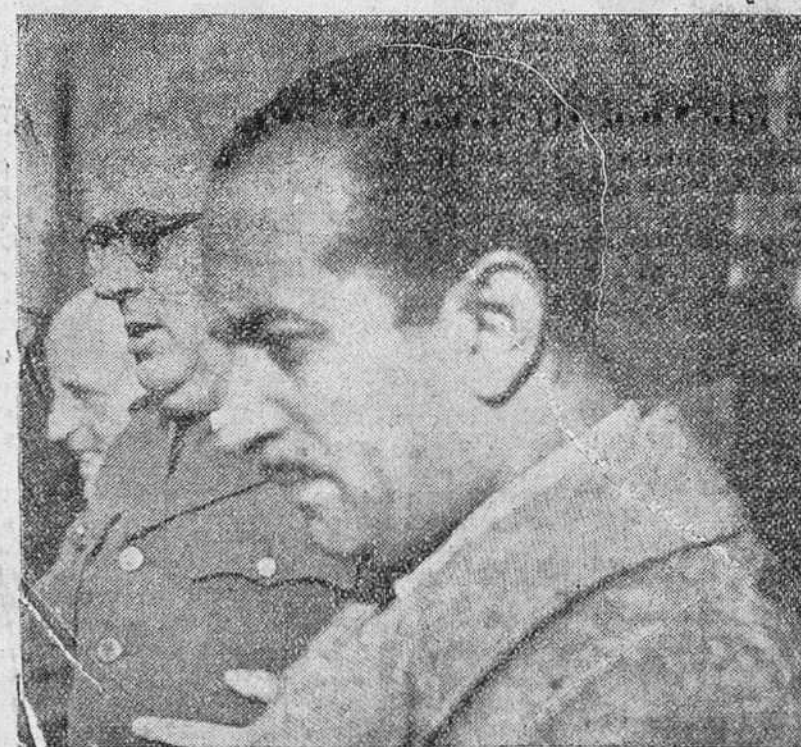
EL CAPITAN GENERAL, EL GOBERNADOR CIVIL Y ALCALDE DE LA CIUDAD, PRESENCIAN, DESDE EL BALCON DE CAPITANIA, EL MAGNO ESPECTACULO DEL GENTIO CONGREGADO ANTE EL HISTORICO EDIFICIO, PARA ACLAMAR A FRANCO EN IMPRESIONANTE MANIFESTACION PATRIOTICA