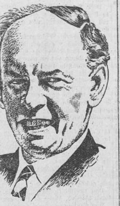
Louis Francis Budenz, (que hace un año reingresó en el seno de la Iglesia Católica, el 11 de Octubre de 1945)...