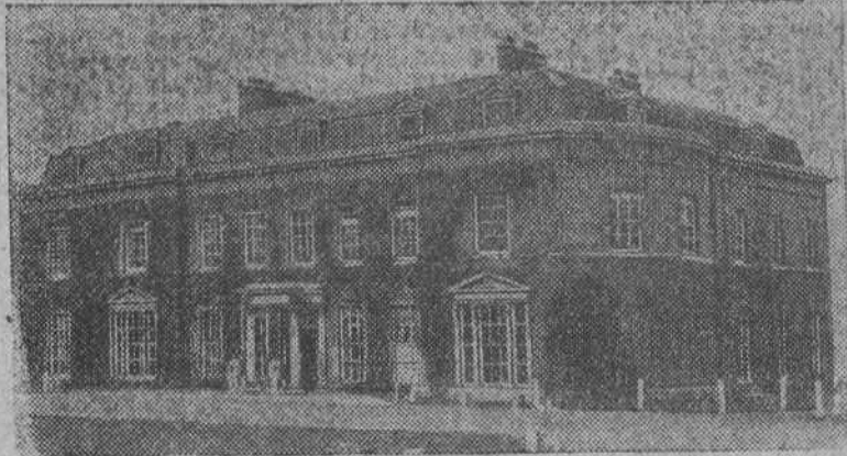
S. M. el Rey Jorge VI de Inglaterra, ha regalado a su hija la princesa Isabel, con motivo del 21 aniversario de su nacimiento, esta magnífica mansión de Sunninghill Park, situada en Windsor Forest.