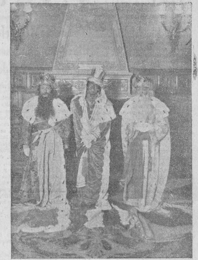
Nuestro fotógrafo sorprendió el domingo, momentos antes de iniciarse la magna cabalgata de los Reyes Magos, a los egregios personajes, decansando de su largo viaje para obsequiar a los niños burgaleses.

El capitán general de la región, teniente general Yague, acompañado de su distinguida esposa y sus angelicales hijas, se desplazó, con un entusiasmo ejemplar y un infatigable celo, a distintas instituciones benéficas, donde hizo entrega de los juguetes, entre constantes demostraciones de gratitud y cariño de los acogidos en los diversos Establecimientos.