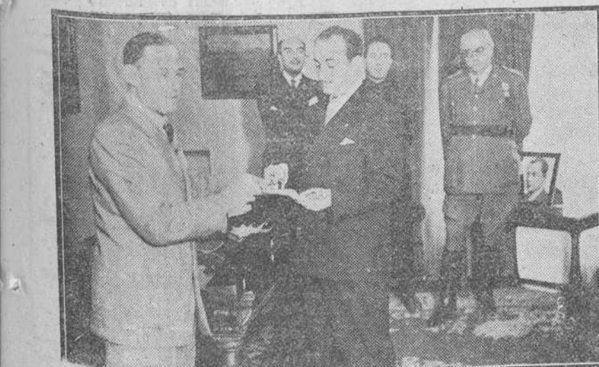
El gobernador civil, señor Rodríguez de Valcárcel, recibe el bastón de mando que le dedican los funcionarios de la Diputación provincial de Santander, como testimonio de recuerdo, gratitud y cariño, en brillante acto de homenaje, presidido por las autoridades montañesas y locales.