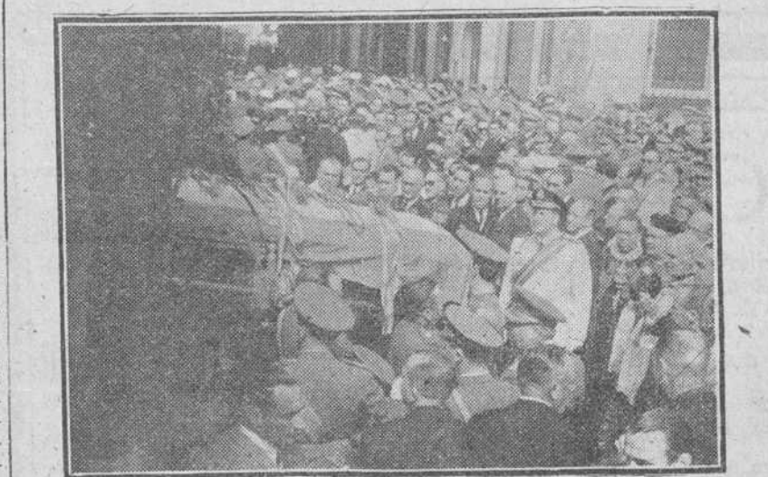
Jerez.—Momento de ser bajado del tren que lo ha conducido a esta capital, el féretro que contiene los restos del glorioso general, para proceder a la inhumación definitiva de los mismos. El acto es presenciado por los ministros y demás representantes del Gobierno, llegados con este objeto de la capital de España.